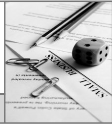
표 목 차